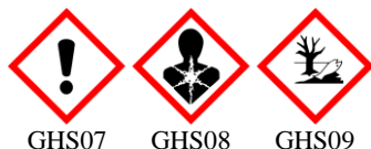
GHS07 GHS08 GHS09